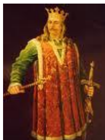
TEFAN CEL MARE(1457-1504)