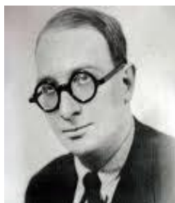
RADU GYR (1905-1975)

ANUL IV, numărul 13 - octombrie-noiembrie 2004