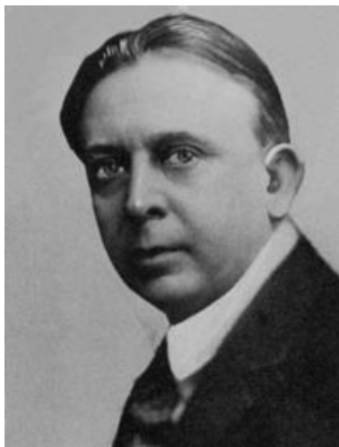
OCTAVIAN GOGA (1881-1938)

Revist de educa ie, cultur , literatur i atitudine, pentru elevi i profesori – îndreptat împotriva prostului-gust, imposturii i agresiunii imoral-antiartistice